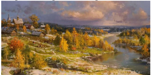
В. Жданов. Покров день

На Руси праздник Покрова Пресвятой Владычицы нашей Богородицы и Приснодевы Марии называли Покров день, а еще: Первое зазимье, Свадебник, Третья Пречистая, Засидки, Обсичане, День Романа Сладкопевца, Покров-Батюшка.