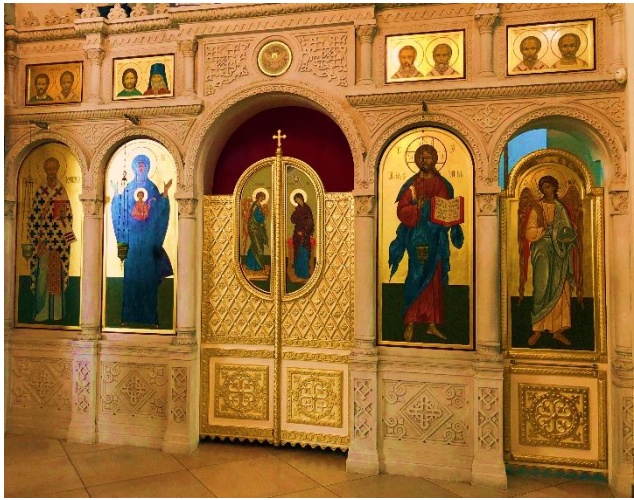
Никольский придел Вознесенского собора г. Звенигорода

Ликийских называли главные соборы. Новгород Великий, Зарайск, Киев, Смоленске, Пскове, Галич, Архангельск, Тобольск и многие другие. В Московской губернии было построено три