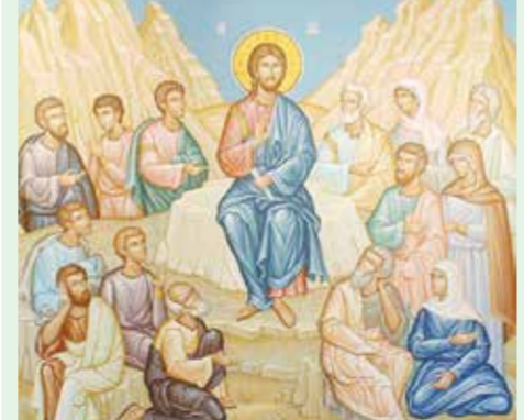
→ Икона «Нагорная проповедь»

«Блаженны нищие духом, ибо их есть Царство Небесное»