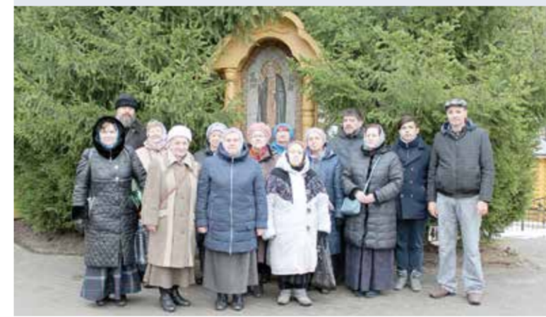
→ У источника преподобного Серафима Саровского в Цыгановке. ФОТО ИЗ АРХИВА ЗВЕНИГОРОДСКОГО БЛАГОЧИНЯ