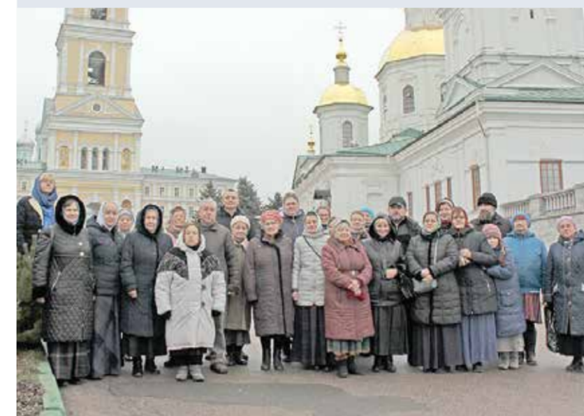
→ Звенигородские паломники у Казанской церкви. На заднем плане колокольня Серафимо-Дивеевского монастыря.