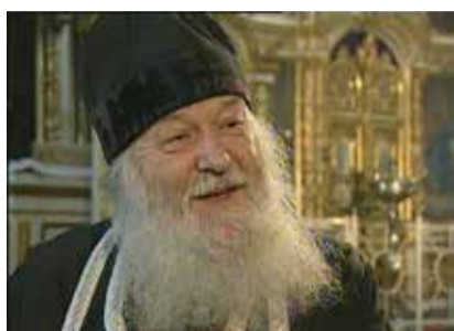
→ Протоиерей Валериан Кречетов.