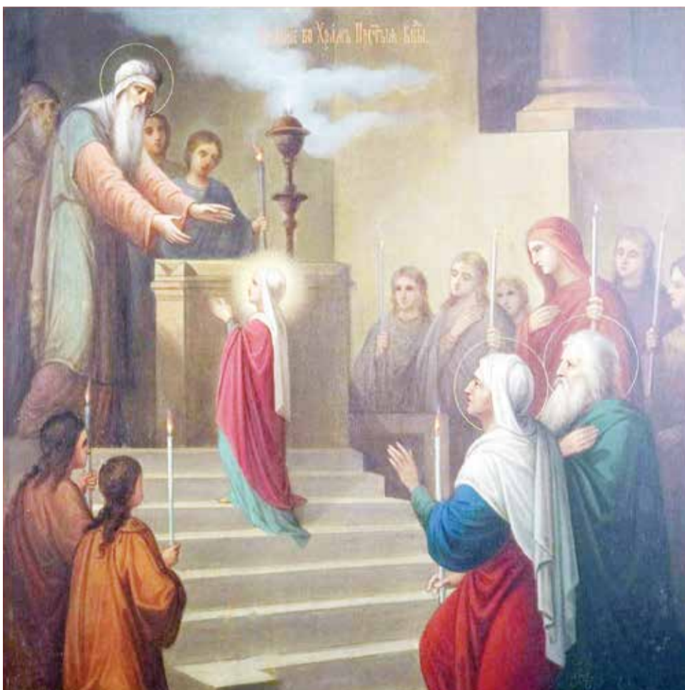
→ Икона «Введение во храм Пресвятой Богородицы».

Иоаким и Анна, родители Пресвятой Богородицы, долго не имели детей и очень скорбели об этом, но не отчаивались, а лишь усиливали пост, молитву и милость свою к ближним. А когда первосвященник не принял жертвы Иоакима, поставив в вину его бездетность, он ушёл в пустыню и молился там со слезами. Анна же, узнав об этом, в скорби припала ко Господу, прося о даровании дитя и обещая посвятить его на служение Богу. Молитва их была услышана, и архангел Гавриил возвестил обоим родителям о рождении дочери, которая станет сосудом избранным и обретёт особую благодать у Бога.