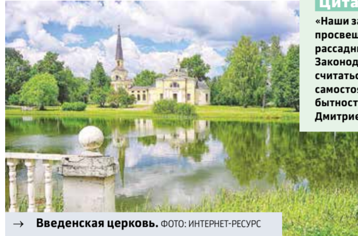
→ Введенская церковь.

Введенская церковь. Введенская церковь. Введенская церковь.